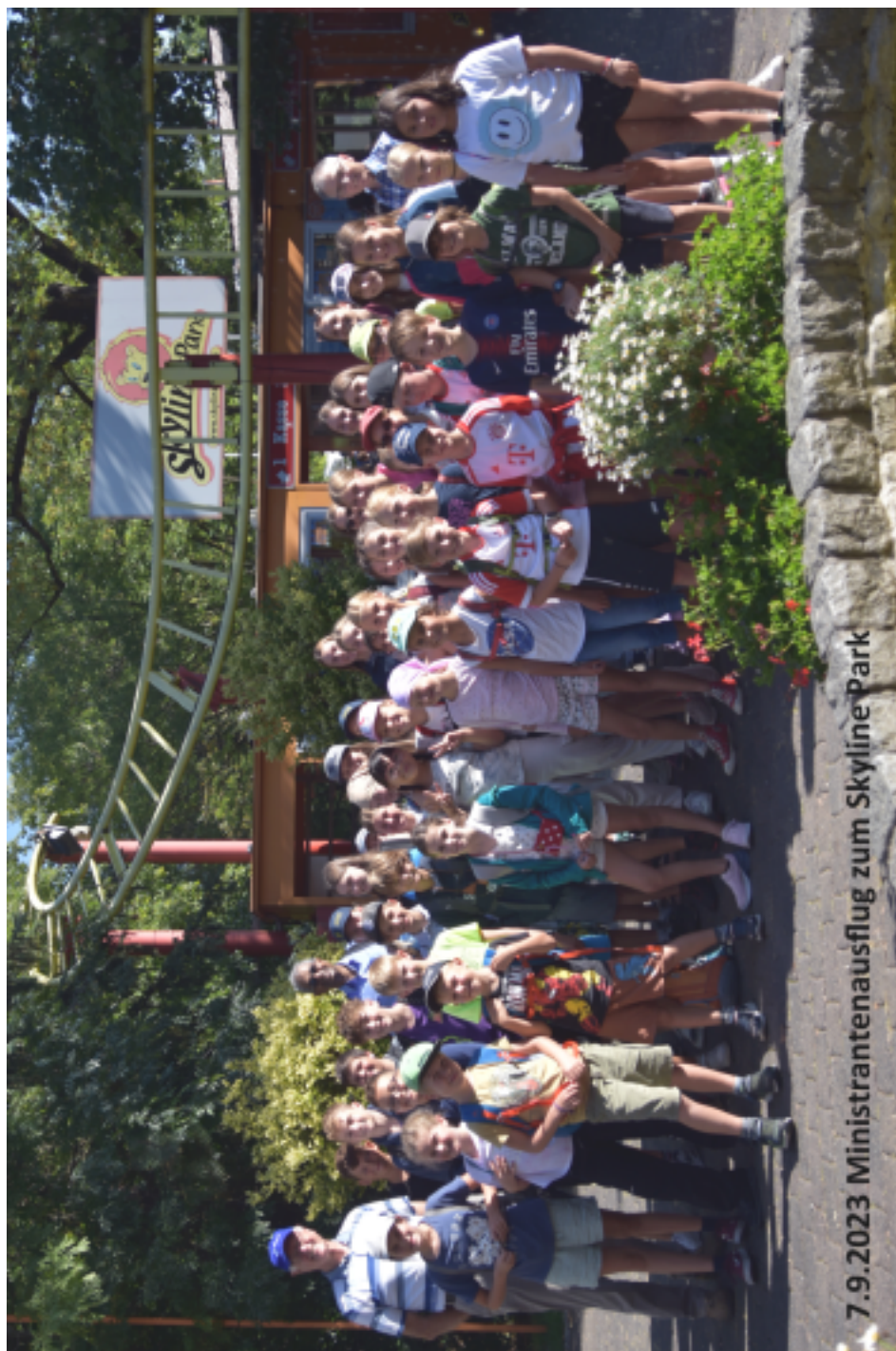
7.9.2023 Ministrantenausflug zum Skyline Park